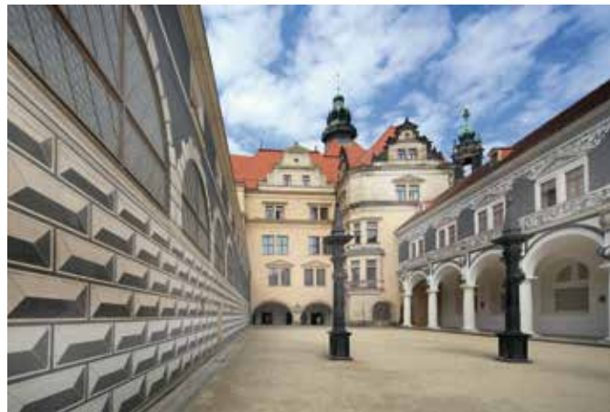
Stallhof, Bogenhalle des Langen Ganges