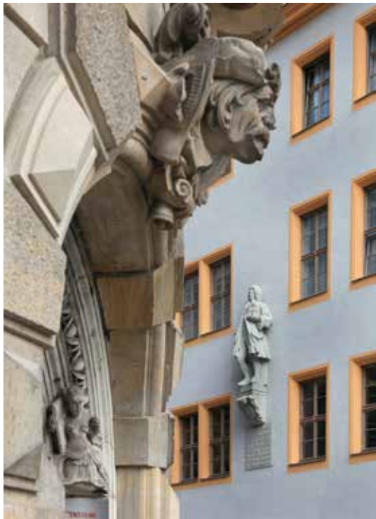
Schlossstraße Dresden, Statue des Zwingerbaumeisters Matthäus Daniel Pöppelmann