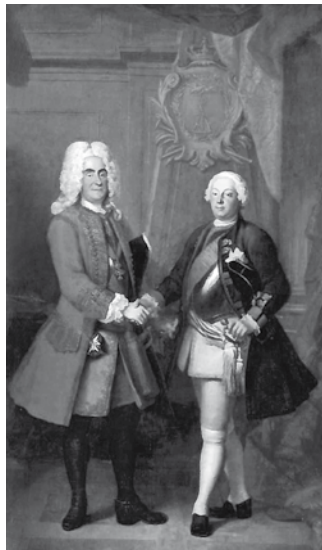
König August II. und der preußische König Friedrich Wilhelm I. von Preußen. Gemälde von Louis de Silvestre, um 1730

Die Staatskrise brachte dem Wettiner eine sichtbare Niederlage. Der Landtag trat 1717 entschieden gegen seine Armee auf. Friedrich August war es gelungen, die Truppen auf eine Stärke von 36.000 Mann zu bringen. Obwohl er damit weit hinter den habsburgerischen und preußischen Kontingenten zurückblieb, war diese Stärke ein