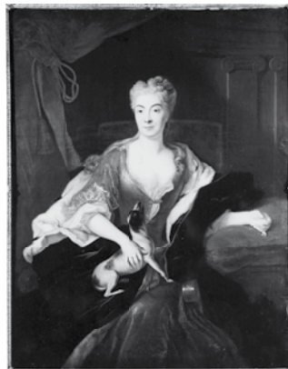
Gräfin Ursula Katharina Lubomirska. Gemälde von Rosalba Carriera, o. J.

die Gunst des Königs. Seine Auszeichnungen zählten, seine Gnade erhob.